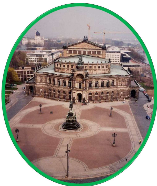
Slika 2. Semperoper