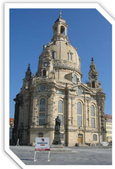
Slika 1. Frauenkirchen

Grad je pretrpio značajna oštećenja u Sedmogodišnjem ratu 1756. – 1763. Za vrijeme Napoleonovih ratova Dresden je bio baza francuske vojske i u blizini grada vodila se jedna od bitaka.