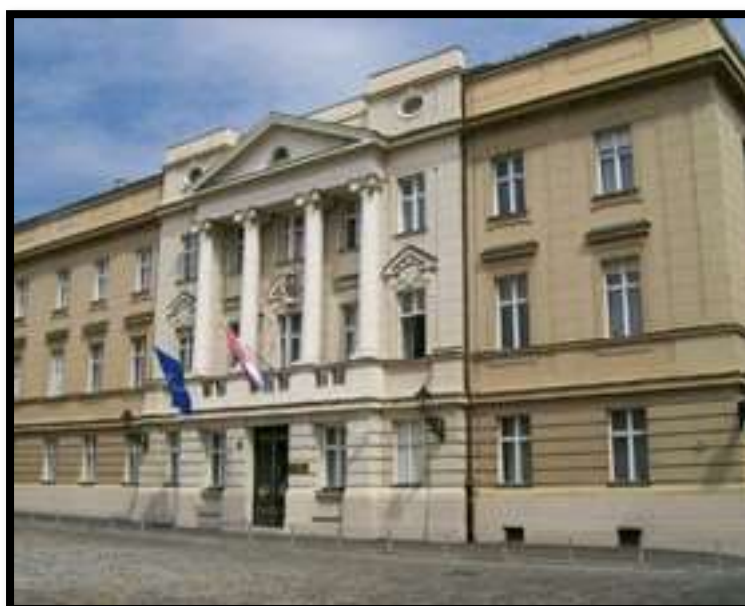
Slika 1. Ustavni sud

U Hrvatskoj su općine i gradovi prema Ustavu, jedinice lokalne samouprave. Teritorij Hrvatske administrativno je podijeljen na 128 gradova i 428 općina. Općine i gradovi u Hrvatskoj čine najnižu razinu samouprave. Hrvatska je podijeljena na dvadeset županija i Grad Zagreb koji ima status županije. Županija obuhvaća više prostorno povezanih općina i gradova na svom području. Površinom je najveća županija Ličko-senjska, a najmanja Međimurska županija. Županije s najviše stanovnika su Grad Zagreb, Splitsko-dalmatinska, Zagrebačka, Primorsko-goranska i Osječko-baranjska.