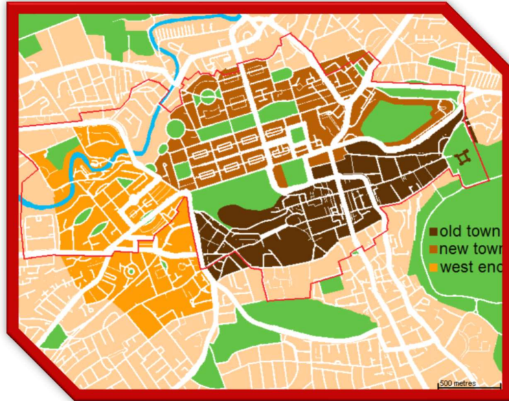
Slika 2. Administrativna podjela

U Edinburghu se nalazi Škotski parlament. Grad je podijeljen na Old Town i New Town. New Town je nastao kao odgovor na prenapučeni Old Town, projektirao ga je u 17.st. arhitekt Robert Adam. Gradom upravlja Unitarno tijelo koje uključuje i 32 lokalna upravna područja koja se rasprostiru na 78 km 2 ruralne okolice.