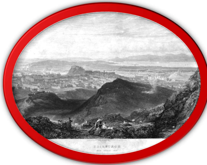
Slika 1. Edinburgh 1826.

Edinburgh je nastao kao utvrda na lako obranjivoj stijeni Castle Rock. Prvi organizirani život se javlja oko 6000 prije Krista u podnožju stijene, u brončanom dobu 1 , tu nastaju prva naselja. Nakon što su Rimljani u 1. stoljeću poslije Krista napredovali u Škotsku došli su u dodir s keltskim plemenom Votadini čija je utvrda Goddodin (Tanka utvrda) već ponosno stajala na stijeni. U 7. stoljeću osvojili su je Englezi iz Northumbrije, uključujući i cijelu južnu Škotsku. Englezi su ga nazvali Eiden Burgh. U 10. stoljeću utvrda je ponovno postala škotska.